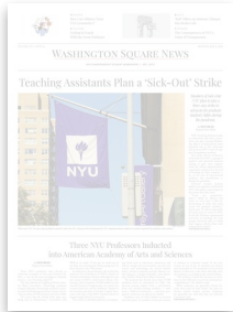
Washington Square News | May 4, 2020 by nyu.news