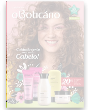
Catálogo 04 2019 O Boticário by oboticariopt