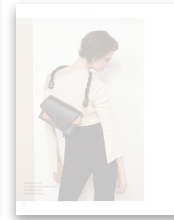
Ipekyol SS19 #1 by ipekyol1