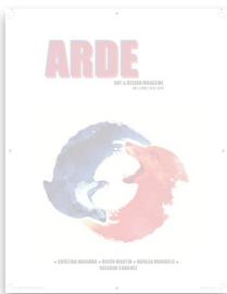
Arde by cristinavarrolo...