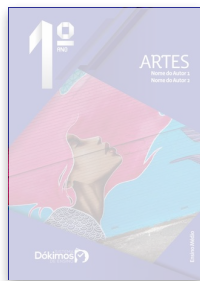
Livro de Artes - Dokimos - Ensino Médio 1 by grupodokimos