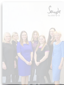
The Semple Edit Issue VII by semple