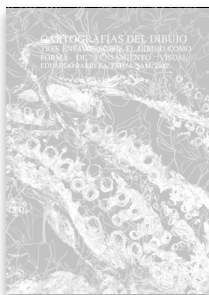
Cartografías del dibujo, Tres ensayos sobre el dibujo como forma de