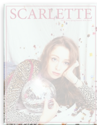
Spring/Summer 2020 Part II by scarlettemagazi...