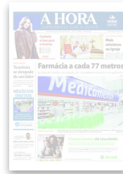
A Hora - 29 de março de 2019 by jornalahoralt...